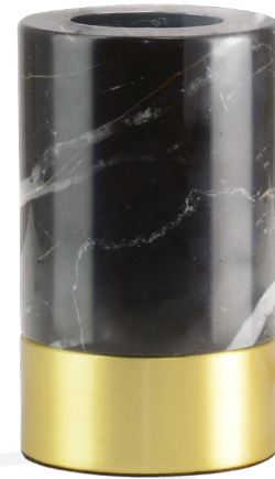
Câble | Cable